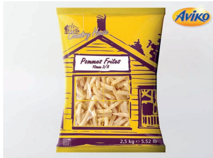
POMMES FRITES Country House