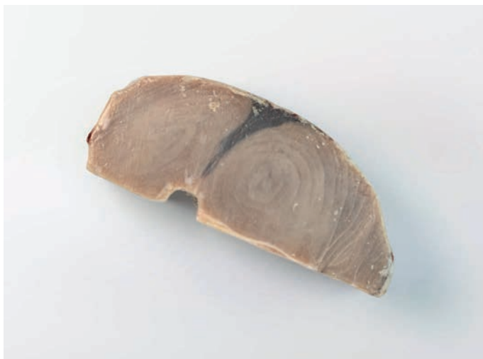
SABLJARKA komadi bez kože Tetrapturus belone/angustirostris