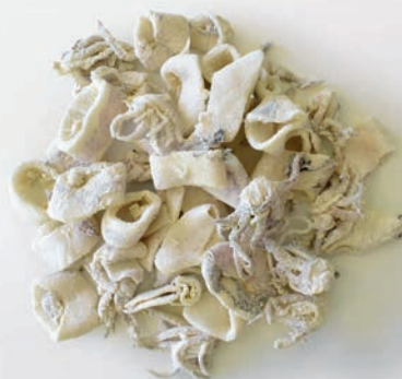
LIGNJA PATAGONICA pobrašnjena, kolutić krak IQF Doryteuthis gahi