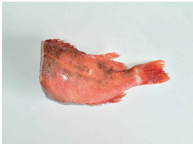
CRVENI BODEČNJAK bez glave Sebastes marinus/mentella