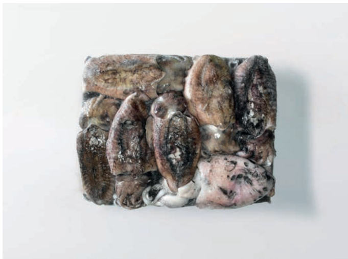
SIPA neočišćena Seppia officinalis