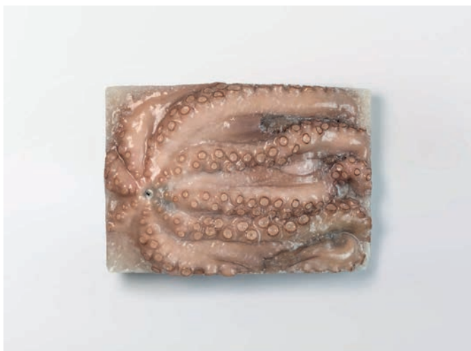
HOBOTNICA MAROKO, očišćena Octopus vulgaris