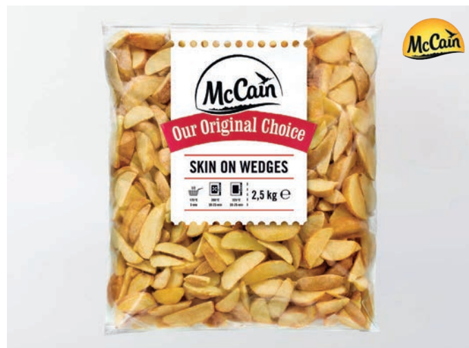
KRIŠKE MLADOG KRUMPIRA S KOŽICOM