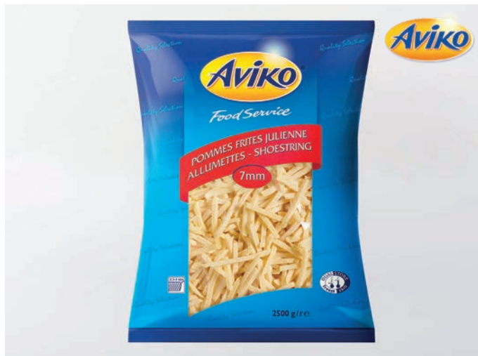
POMMES FRITES Juliene