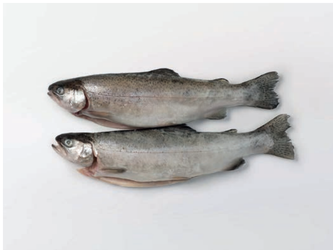
PASTRVA, očišćena Oncorhynchus mykiss