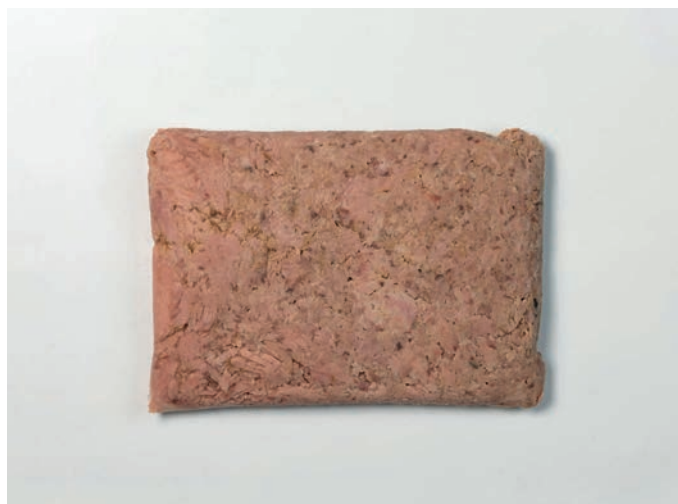
TUNA komadi u suncokretovom ulju, alu vrećica 1000 g Katsuwonus pelamis