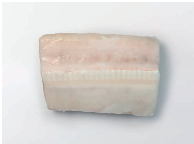
MORSKI PAS komadi, bez kože Prionace glauca