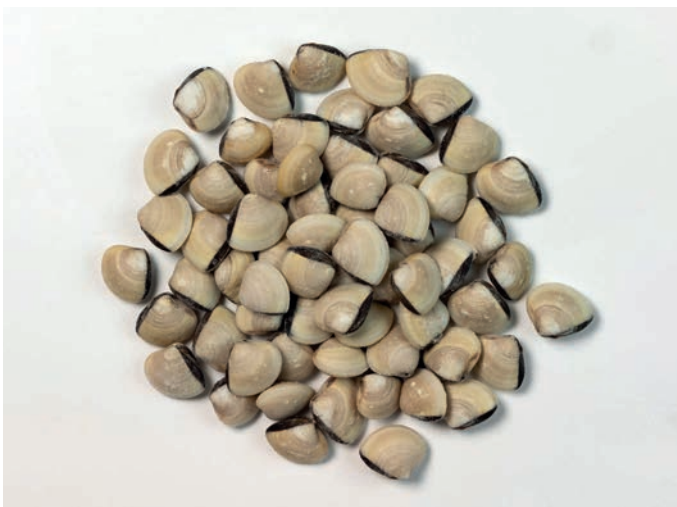
VONGOLE u školjci Meretrix lyrata