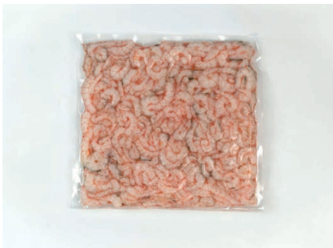
KOZICA JADRANSKA, meso Parapenaeus longirostris