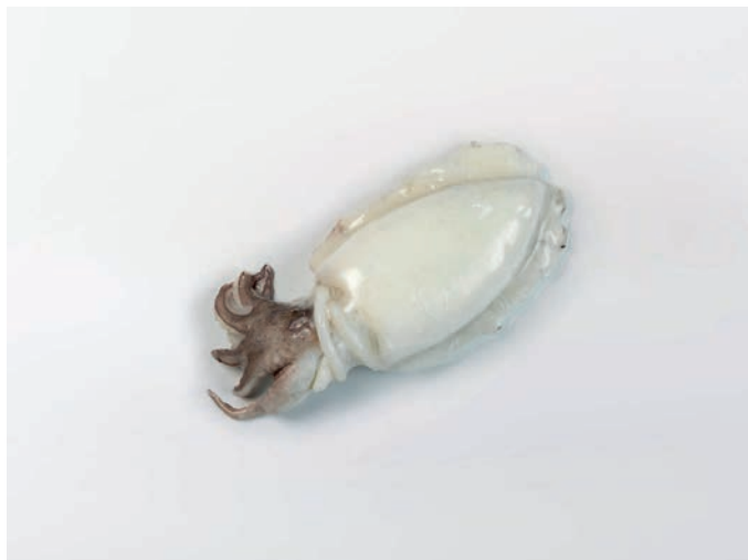
SIPA očišćena Seppia officinalis/pharaonis