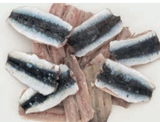
SRDELA JADRANSKA, filet Sardina pilchardus