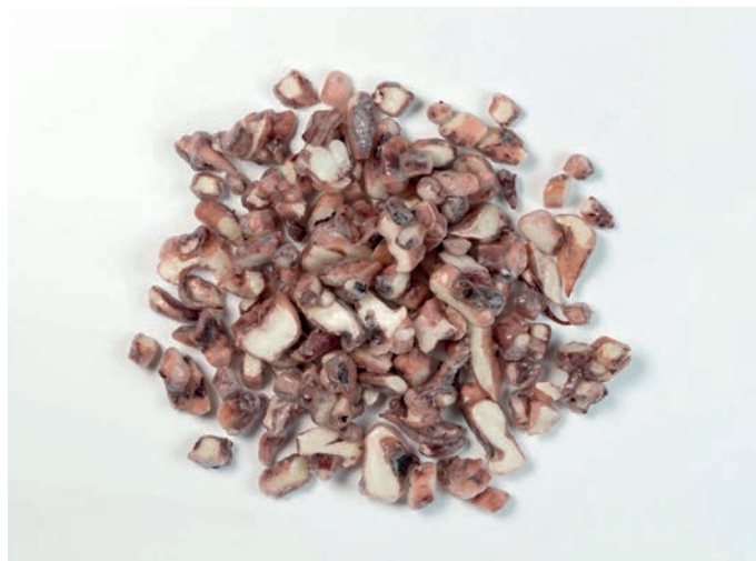
LIGNJUN krakovi, rezani i kuhani, premium Dosidicus gigas