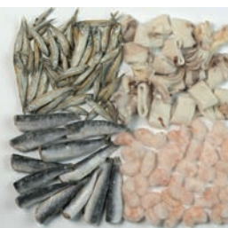
Mješavina za morsku frituru