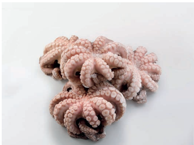
HOBOTNICA FILIPINI, očišćena Octopus vulgaris