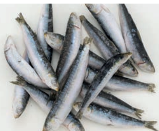
SRDELA JADRANSKA, cijela Sardina pilchardus