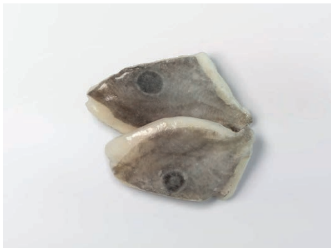
KOVAČ filet, s kožom Zeus faber