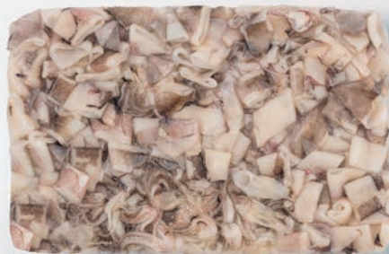
LIGNJA PATAGONICA kolutić krak Doryteuthis gahi