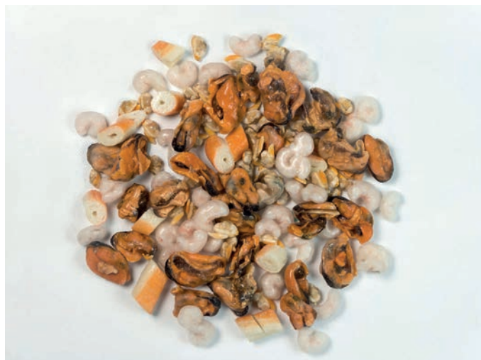
PLODOVI MORA kozice, dagnje, surimi, vongole