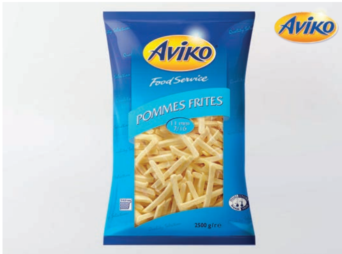
POMMES FRITES original