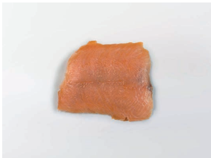
LOSOS dimljeni, narezani Salmo salar