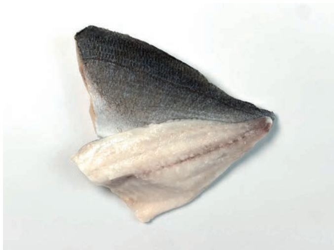
ORADA filet, s kožom Sparus aurata