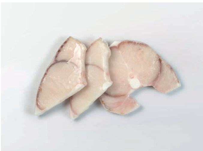
MORSKI PAS odrezak, bez kože Prionace glauca