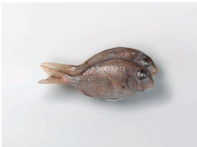
ZUBATAC Dentex spp.