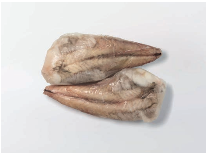
GRDOBINA rep, bez kože Lophius vomerinus