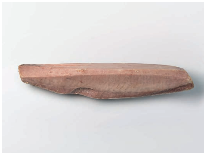
TUNA komadi, bez kože Thunnus albacares/obesus