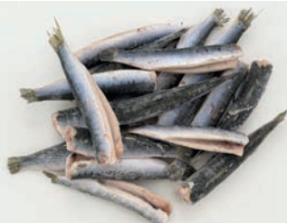
SRDELA JADRANSKA, očišćena, bez glave Sardina pilchardus