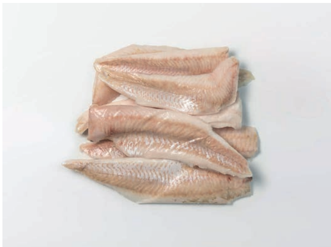
OSLIĆ filet, bez kože Merluccius hubbsi