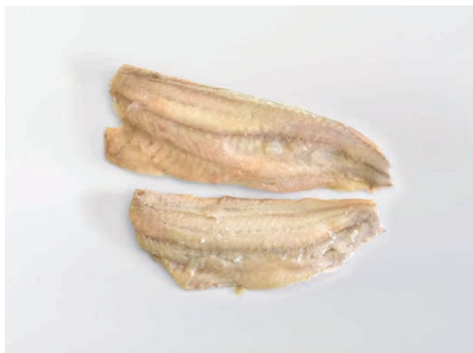
BAKALAR filet, bez kože Polachius virens