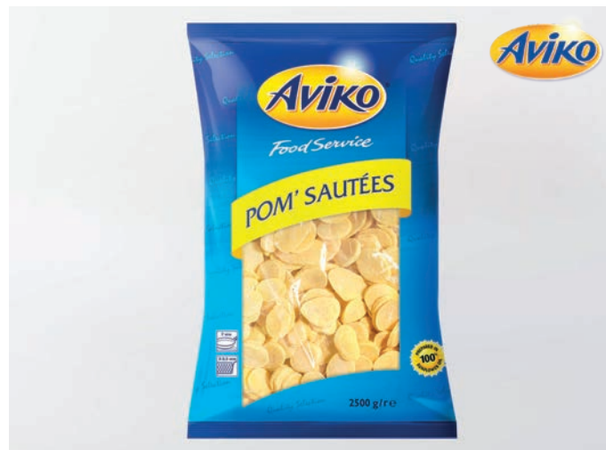
PLOŠKE OD KRUMPIRA