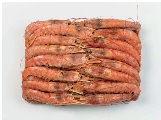
KOZICA ARGENTINA, cijela Pleoticus muelleri