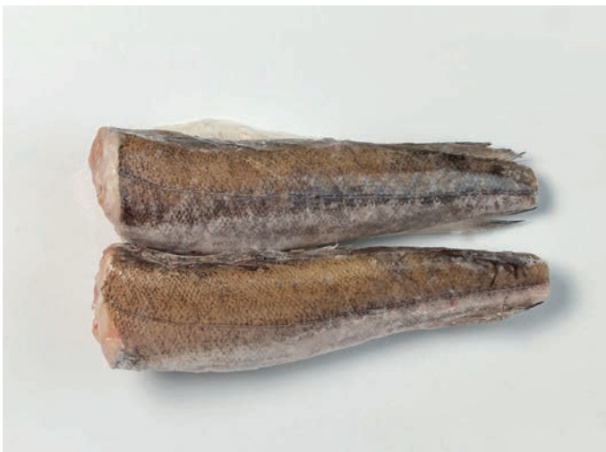
OSLIĆ bez glave Merluccius hubbsi