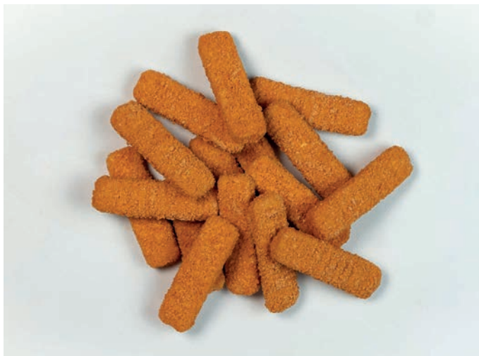
PANIRANI RIBLJI ŠTAPIĆI