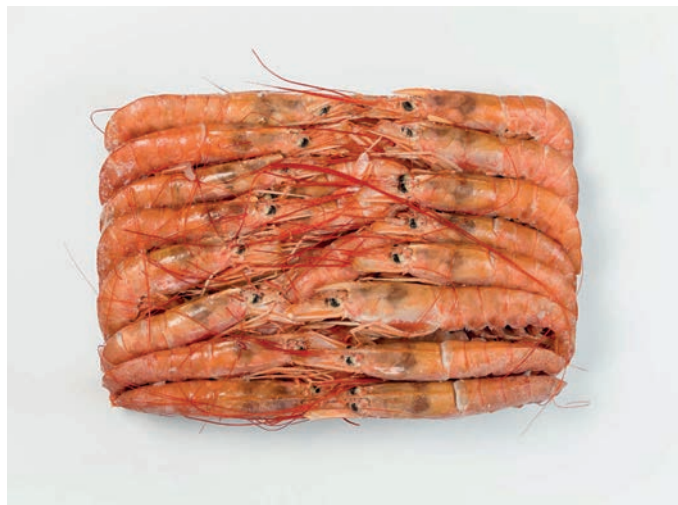
ŠKAMP stiropor 1500 g Nephrops norvegicus