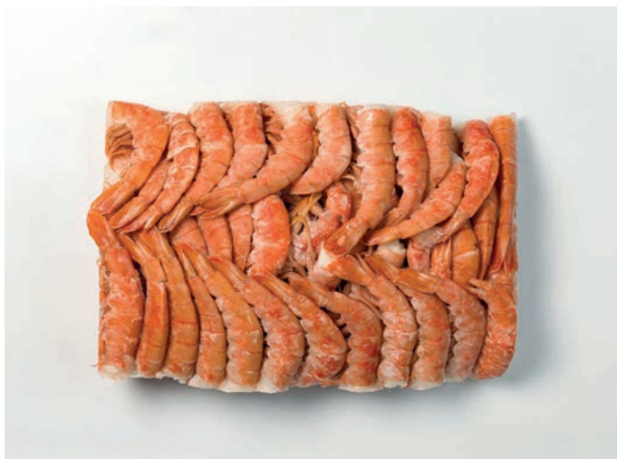
KOZICA ARGENTINA, repovi u ljusci Pleoticus muelleri