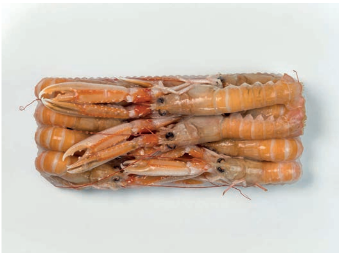
ŠKAMP plitica 1000 g Nephrops norvegicus