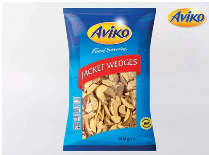
KRIŠKE MLADOG KRUMPIRA S KOŽICOM