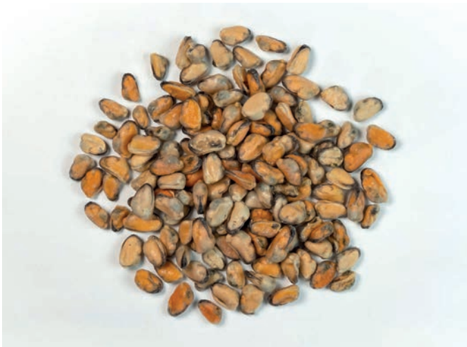
DAGNJE meso Mytilus galloprovincialis/chilensis