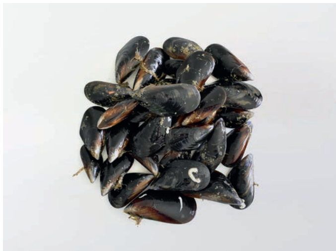
DAGNJA JADRANSKA, svježa Mytilus galloprovincialis