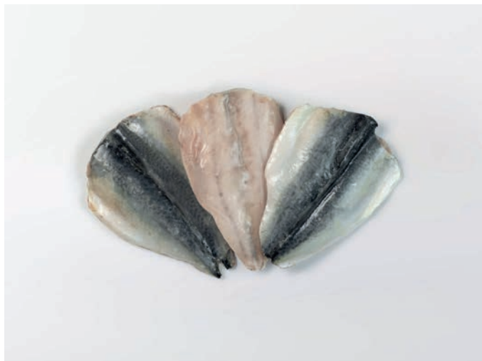
SKUŠA filet, s kožom Scomber japonicus