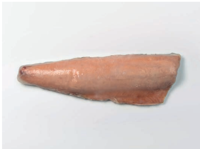
LOSOS filet, s kožom Oncorhynchus keta