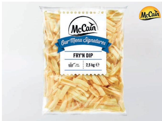
POMMES FRITES Fry & Dip