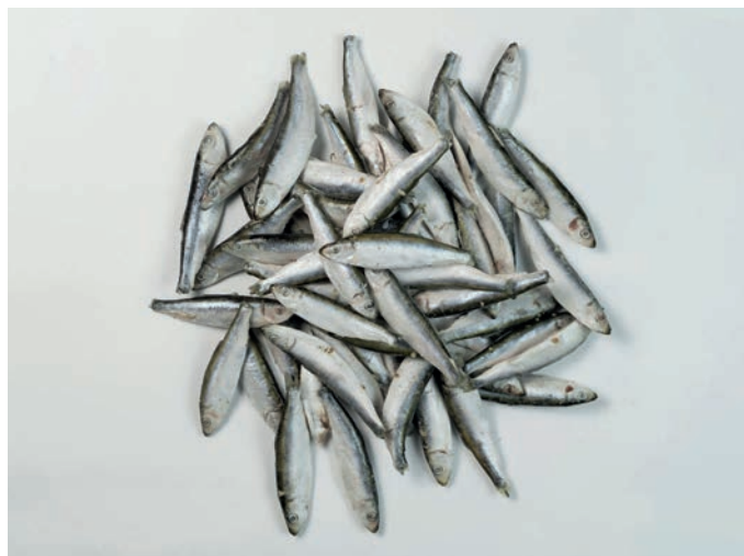
PAPALINA Sprattus sprattus