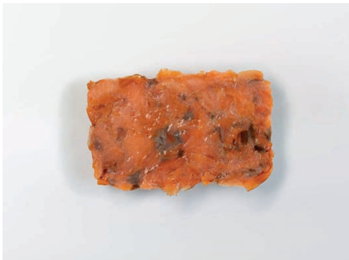
LOSOS dimljeni, komadići Salmo salar