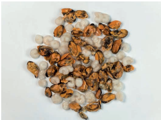
PLODOVI MORA kozice, dagnje, vongole