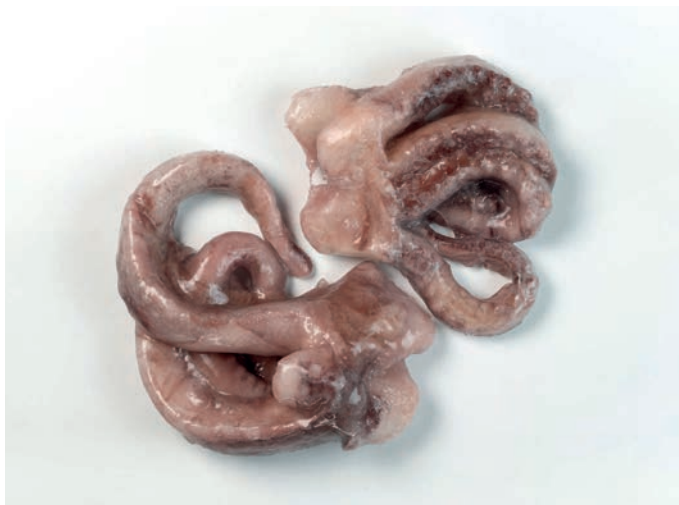
LIGNJUN krakovi Dosidicus gigas