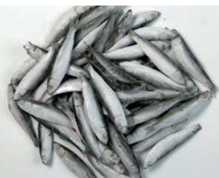
PAPALINA JADRANSKA Sprattus sprattus