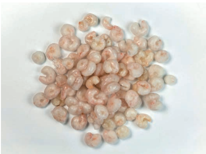
KOZICA očišćena, vrećica 1000 g Solenocera melantho