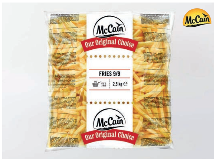
POMMES FRITES Original