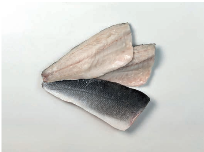
BRANCIN filet, s kožom Dicentrarchus labrax