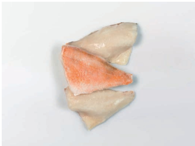
CRVENI BODEČNJAK filet, s kožom Sebastes mantella/alutus