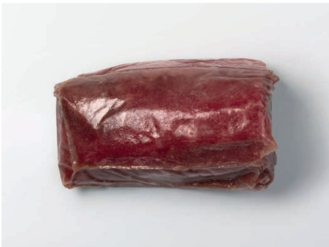
TUNA komadi bez kože, premium Thunnus albacares