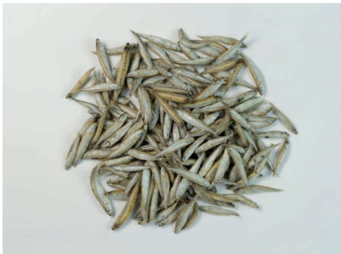
GAVUN Atherina boyeri