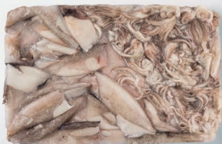
LIGNJA PATAGONICA tuba krak Doryteuthis gahi