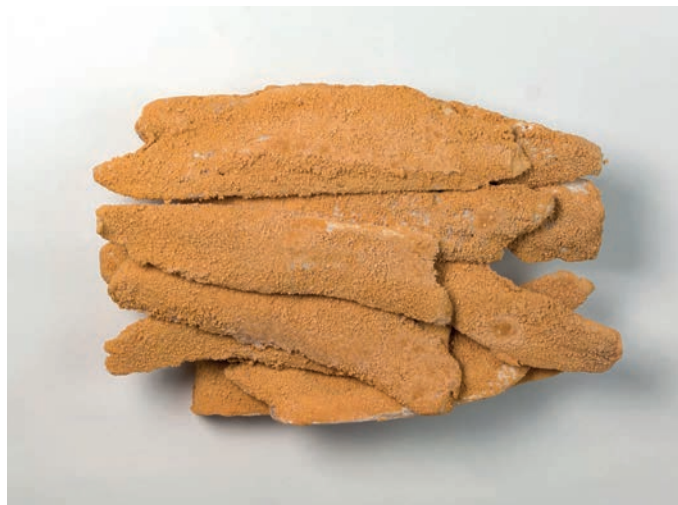
PANIRANI OSLIĆ FILET