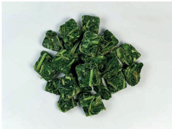
BLITVA LIST, A klasa, kocka