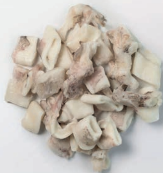
LIGNJA PATAGONICA kolutić krak IQF Doryteuthis gahi