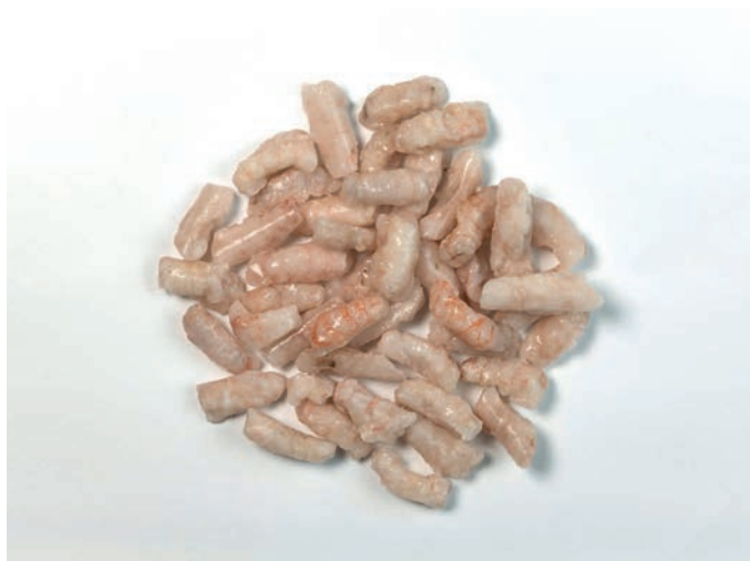
ŠKAMP meso, uvoz, vrećica 1000 g Nephrops norvegicus