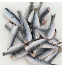
SRDELA JADRANSKA, bez glave Sardina pilchardus