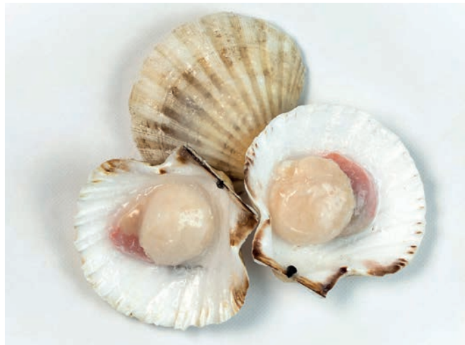
KAPESANTE u pola školjke Pecten maximus