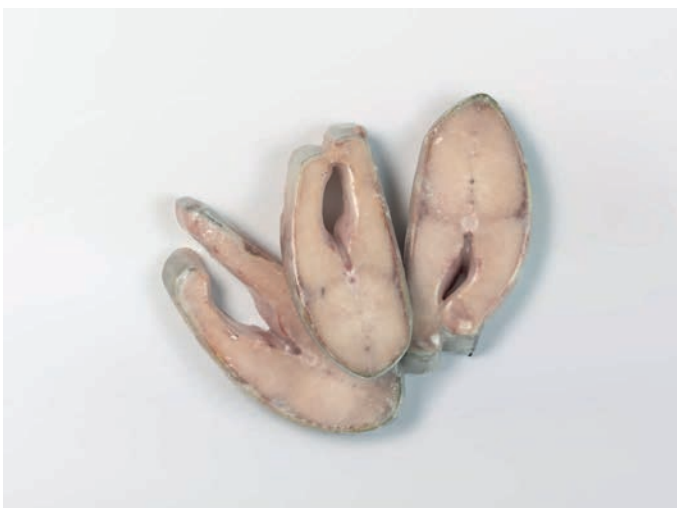
LOSOS odrezak, s kožom Oncorhynchus keta