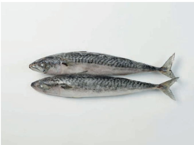
SKUŠA Scomber scombrus