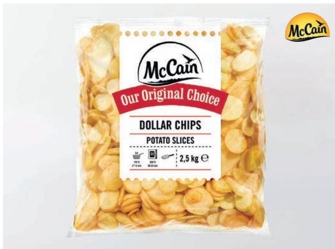
PLOŠKE OD KRUMPIRA