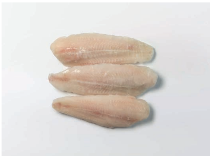
PANGASIUS filet, bez kože Pangasius hypophthalmus